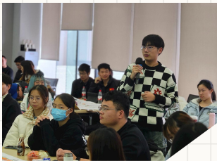
- 落实国家战略 服务高校发展 赋能校企合作 助力国际交流 -